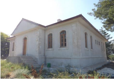
Fig. 5. Tefenni Redif Dairesi Güneydoğu Köşeden Genel Görünüm