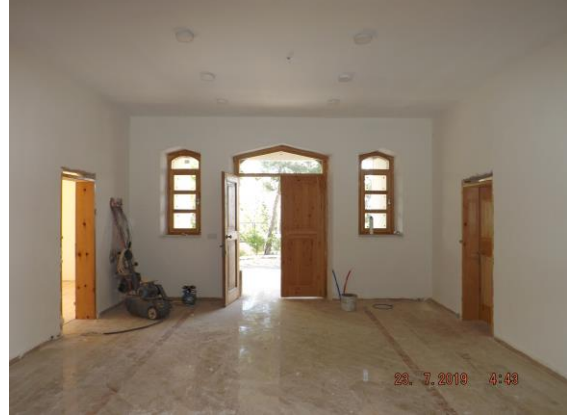
Fig 3-4. Tefenni Redif Dairesi Kuzey Cephe ve Koridordan Görünüm