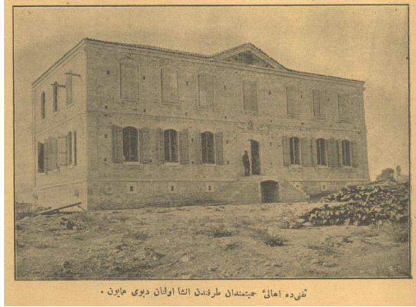
Fig. 8. Tefenni Redif Taburu İçerisinde Yer Alan Deppoy-u Hümayun (Servet-i Fünun Dergisi 550, 53)

19. yüzyılda Osmanlı Devleti'nde askeri, siyasi, eğitim, ekonomi vb. gibi alanlarda birçok köklü değişim yaşanmış ve devlet teşkilatı daha kurumsal bir kimliğe bürünmüştür. Haliyle bu değişimler, ortaya çıkan yeni kurumlar için bina ihtiyacını gündeme getirmiştir. Redif taburlarında yer alacak gerekli binaların hızlı bir şekilde inşasının gerekli olmasından kaynaklı olarak bireysel tasarıma ket vuran ancak hızlı üretim için de gereklilik arz eden “ Tip Proje Geleneğinin ” olduğu mevcut örneklerden anlaşılmaktadır. İmparatorluk coğrafyasında tip proje geleneğinin en önemli temsilcisi olan redif binalarını değerlendirmeye tabii tutmadan önce cevaplanması gereken şu soruyu gündeme almak gerekmektedir; 1834 yılında teşkil edilen bu kurum için gerekli binalar neden 1890'lı yıllarda inşa edilmiştir? Bilindiği üzere, benzer sürecin hükümet konakları veyahut eğitim yapıları için de geçerli olduğu ve bu gibi yapılarda, yeni bina inşa edecek imkân yaratılincaya kadar bölgedeki kullanılabilir binaların ihtiyacı geçici olarak karşılayacak şekilde isticar edildiği arşiv belgelerinde sıkça zikredilmektedir. Ancak Redif Taburları için durumun biraz daha farklı olduğunu Afyonkarahisar örneği üzerinden açıklayabiliriz. Osmanlı idari taksimatında, Karahisar-ı Sahip Sancağı'nda 1890-1895 yılları arasında