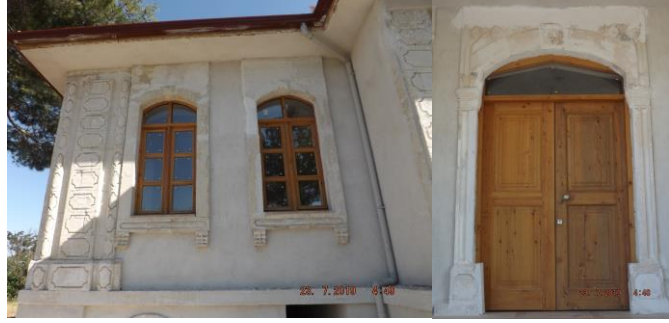
Fig. 6-7. Tefenni Redif Dairesinde Süsleme Detayları

Tefenni Redif Taburu içerisinde günümüze ulaşan ve yukarıda plan, cephe ve süsleme bağlamında ele aldığımız Redif Binası haricindeki günümüze ulaşamayan binalardan biri olan ve açılış görselinde “ Tefennide Ahali Hamiyetmendân Tarafından İnşa Olunan Deppoy-u Hümayun ” olarak zikredilen yapının -benzer örnekler göz önünde bulundurulduğunda- inşaatının 1901 yılında henüz tamamlanmadığını söyleyebiliriz. Söz gelimi, imparatorluk coğrafyasında inşa edilen deppoy-u hümayun binalarının istisnasız revaklı girişe ve balkona sahip olduğu görülürken, Tefenni örneğinde bu revakın henüz tasarıma dahil edilmediği anlaşılmaktadır. Ancak Neo-Klasik mimarinin bir diğer unsuru olan üçgen alınlığa tasarımda yer verildiği dikkat çekmektedir. Bu özellikler dışında örneklerini hemen hemen her bölgede gördüğümüz deppoy-u hümayun binalarında olduğu gibi Tefenni örneğinde cephelerde yer alan pencere formları ve sayıları bu binaların birer tip proje eseri olduğuna işaret eder (Fig. 8).