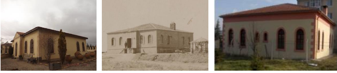
Fig. 17-18-19. Bolvadin (Kadir Türkmen), Eşme ve Kalecik (Özgen 2015) Askeri Karakol Binaları

Redif taburlarında olası bir savaş için gerekli malzemenin muhafaza edildiği cephanelik binalarının masif bir görünüme sahip olduğu ve üzerinin iki yana eğimli beşik çatı ile örtüldüğü görülmektedir. Tefenni örneği ile benzer cephanelik binası örnekleri, Ürgüp ve Taşköprü Redif Taburlarında mevcuttur (Fig. 20-21).