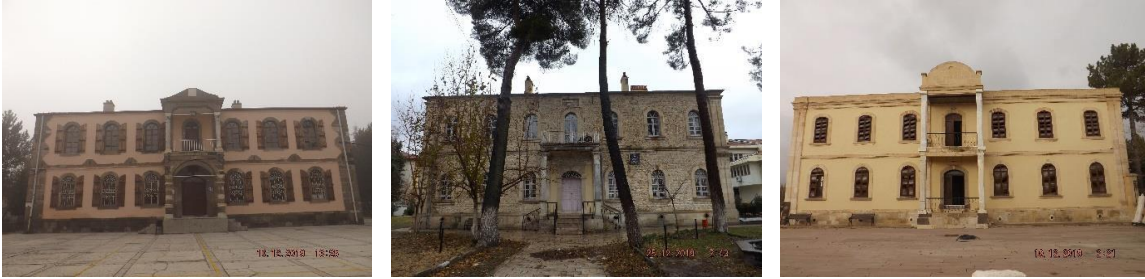
Fig. 14-15-16. Sincanlı (Sinanpaşa), Çivril ve Bolvadin Redif Depoları (Kadir Türkmen)

Redif Taburlarının en mütevazı yapısı olan askeri karakol binaları bazı belgelerde “Neferat Koğuşu” olarak da zikredilmektedir. Görevli askerin barınması aynı zamanda bölge güvenliğinin sağlanması işlevi sürdüren bu yapıların tek katlı olarak inşa edildiğini söylemiştik. Bu yapılarda girişin beden duvarlarından öne doğru taşıntı yaparak cepheyi simetrik olarak ikiye böldüğü ve iki yanına ikişer pencere yerleştirildiği görülmektedir. Giriş aksında uzayan koridorun iki yanına koğuşların yerleştiği bu yapılarda yan cephelerin dörder pencere ile hareketlendirildiği Tefenni örneğinin yanı sıra Bolvadin, Eşme ve Kalecik örneklerinde karşımıza çıkmaktadır (Fig 17-19).