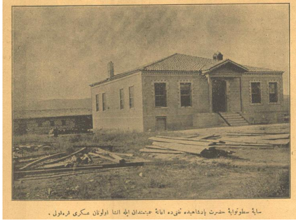
Fig. 9. Tefenni Redif Taburu İçerisinde Yer Alan Askeri Karakol (Servet-i Fünun Dergisi 550, 52)