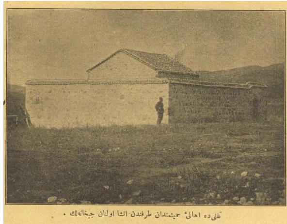
Fig. 10. Tefenni Redif Taburu İçerisinde Yer Alan Cephanelik (Servet-i Fünun Dergisi 550, 53)