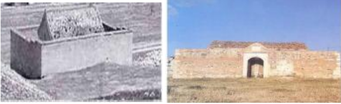
Fig 20-21. Ürgüp ve Kalecik Cephanelik Binaları (Özgen 2013)

Redif taburlarında olası bir savaş için gerekli malzemenin muhafaza edildiği cephanelik binalarının masif bir görünüme sahip olduğu ve üzerinin iki yana eğimli beşik çatı ile örtüldüğü görülmektedir. Tefenni örneği ile benzer cephanelik binası örnekleri, Ürgüp ve Taşköprü Redif Taburlarında mevcuttur (Fig. 20-21).