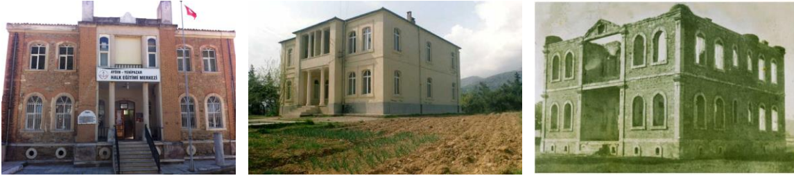
Fig. 11-12-13. Yenipazar (Yılmaz 2015), Çal ve Çivril (Sayhan 2018) Redif Daireleri