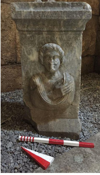
Fig. 3. Büstlü Bomos