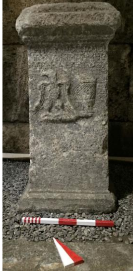
Fig. 7. Kartal-Kalathos