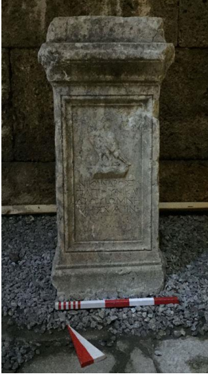
Fig. 6. Kaide Üstünde Kartal