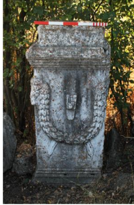
Fig. 2. Girland-Stylus