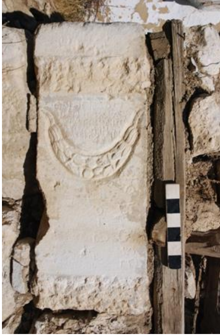
Fig. 1. Girland-Yazıt