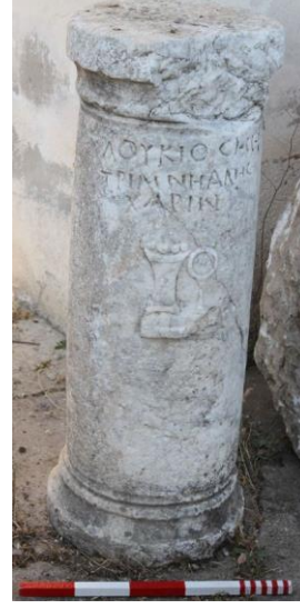
Fig. 8. Kalathos-Ayna