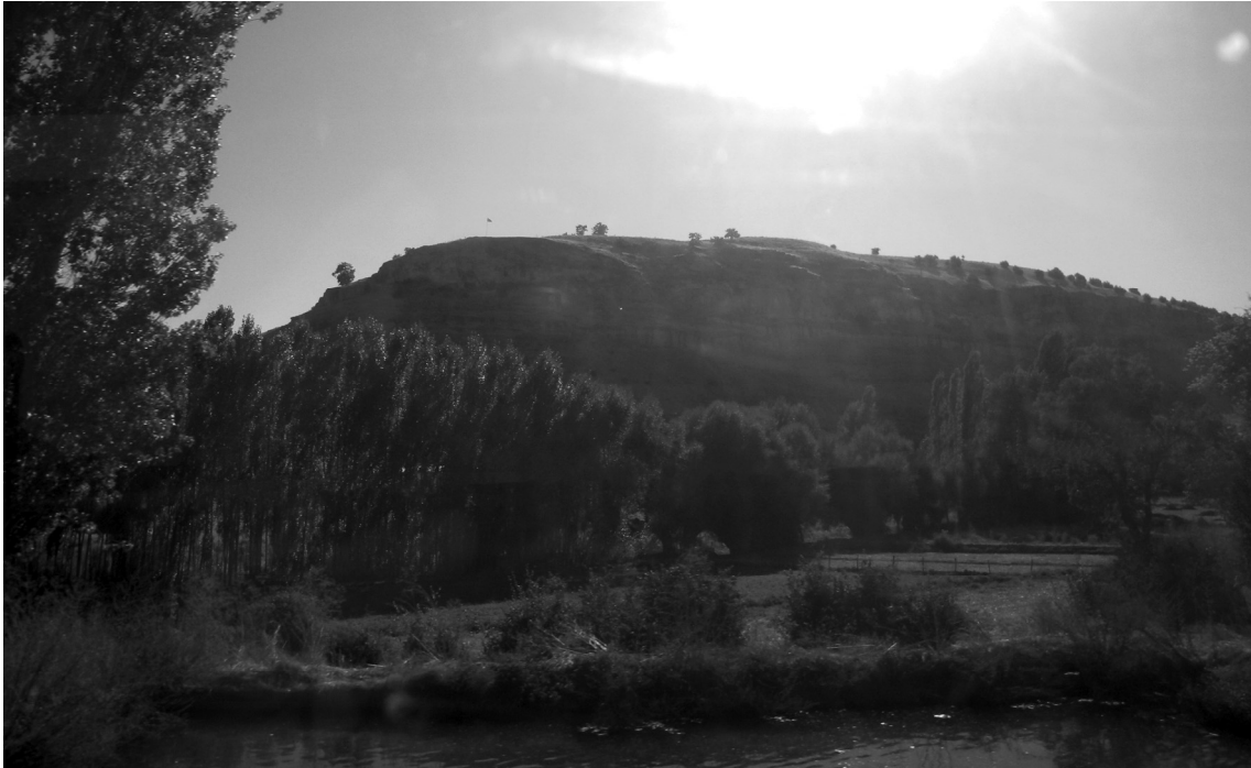
Figür 1. Kirvat Kalesi ve Deresi.