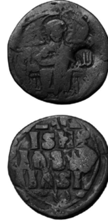
Fig. 6. Lillah (Allah) kontrmarklı Bizans anonim follis