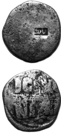
Fig. 4. Atabeg kontrmarklı Bizans anonim follis