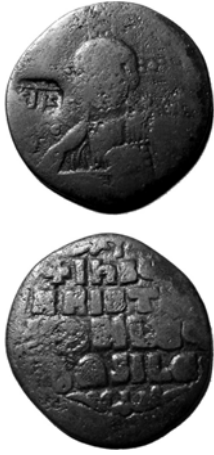
Fig. 1. Adl kontrmarklı Bizans anonim follis

Sadece ağırlığı belirtmek için kullanılan “ adl ” kontrmarkının bir diğer yazılışının “ dal ” olduğu bilinmektedir. Fakat bu bir kontrmark işareti olmaktan ziyade M ve N harflerini karşılamaktadır (Fig. 1). Lowick, “ Adl ” kontrmarkının “ doğru ve adil ” anlamına geldiğini söylemektedir (Lowick, 1977, 38). Devletin halk üzerinde iyi bir imaj çizebilmesi uygulanan bu kontrmark gayet stratejik bir unsur olarak görülebilir.