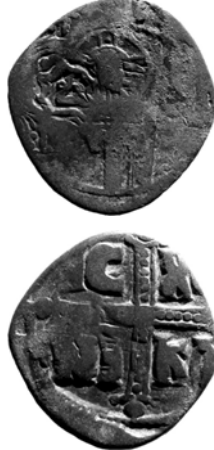
Fig. 5. Najm kontrmarklı Bizans anonim follis