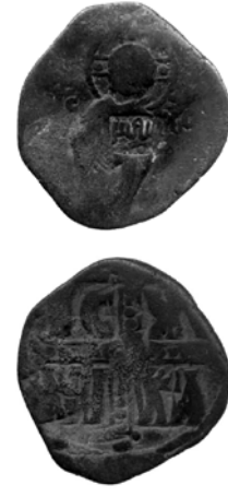
Fig. 3. Shams kontrmarklı Bizans anonim follis