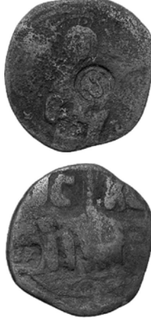
Fig. 2. Izz kontrmarklı Bizans anonim follis