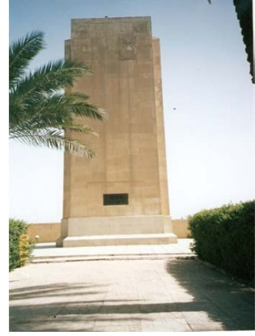
Fig. 4 Kut Türk Şehitliği Abidesi