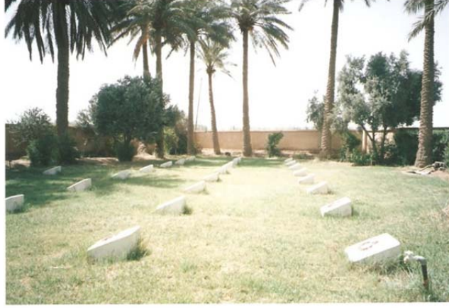
Fig. 5. Kut Türk Şehitliği

Şöyle ki, Milli Savunma Bakanlığı resmi internet sitesinin “ Şehitliklerimiz ” başlıklı linkinde yer alan sayfada Irak’ta iki adet Türk Şehitliği’nin bulunduğu belirtilmektedir. Bunlardan ilki “ Bağdat Türk Şehitliği ”, diğeri “ Kut Türk Şehitliği ”dir. Kut Türk Şehitliği hakkında verilen bilgilerde; şehitliğin, eski adı “ Kut ” olup 1976 yılındaki isim değişikliğinden ötürü “ Vasıt ” olarak bilinen şehrin aynı zamanda merkezi konumundaki Kut şehrine bağlı “ Seyit Haşim Köyü ”nde yer aldığı belirtilmektedir. I. Dünya Savaşı’nın Irak Cephesi’nde gerçekleşen Kutü’l-Amare Savaşlarında şehit düşüp isimleri tespit edilebilen 7 subay ve 43 ere ait mezarın bulunduğu bu şehitliğin arazisinin ise 1952 yılında Iraklı bir kadın tarafından Türkiye Cumhuriyeti’ne bağışlandığı ve aynı yıl şehitliğin yapıldığı belirtilmektedir (MSB. Resmi İnternet Sitesi, Erişim Tarihi: 02.11.2015. http://www.msb.gov.tr/Sehitlikler/YurtDisiSehitlikleri ).