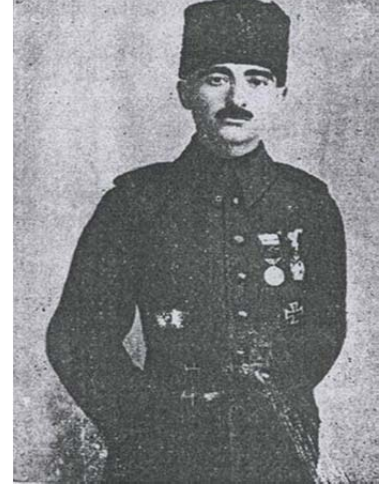
Fig. 3. Kut'ül-Ammare Kahramanı Halil (KUT) Paşa.

Öyle ki, ordu komutanı Halil Bey, İngiliz askerlerinin teslim alınmasının ardından, 29 Nisan 1916'da, askerlerine yaptığı konuşmada; kendilerini verdikleri amansız mücadeleden ötürü kutlamış ve bugün (29 Nisan) " Kut Bayramı " olarak ilan ettiğini bildirerek, her yıl bugün şehit askerlerimize dualar edilmesini istemiştir (Sorgun 2010, 143-144). Üstelik Osmanlı'nın lekelenmiş namını yeniden parlatan Albay Halil Bey'e, buradaki başarısından ötürü " Paşa " unvanı verilmiş, kendisi Kutü'l-Amare fatihi olarak alkışlanmış ve soyadı kanununun çıkması üzerine de " Kut " soyadını almıştır (Erickson 2009, 150).