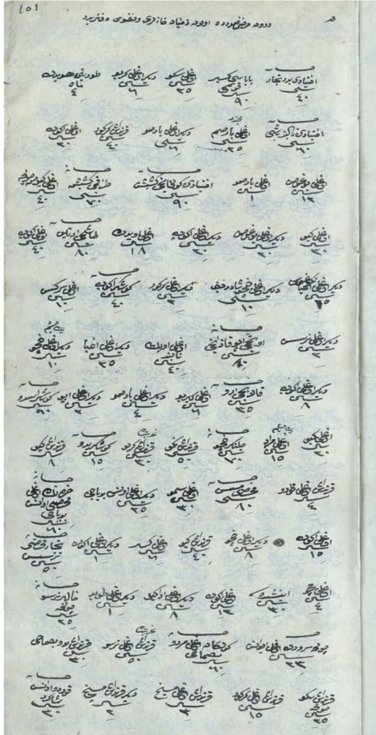
Fig. 2. Hicri 1251 Tarihli Hısnımansur Nüfus Defteri'nde Gayrimüslim hanelerinin kaydedildiği ilk sayfa.