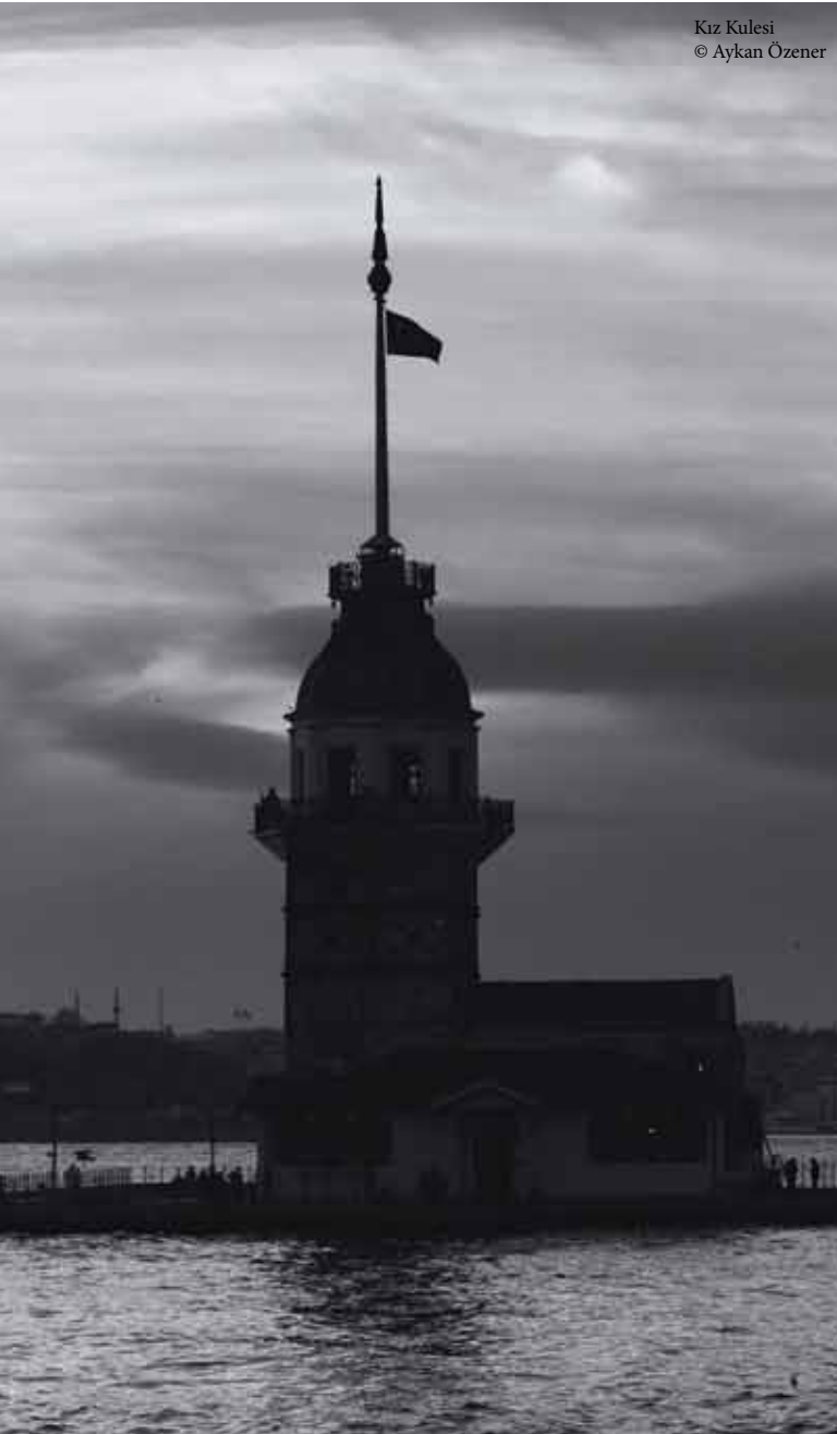
Kız Kulesi

D iodoros'tan öğrendiğimize göre, MÖ 403 yılında Byzantion'un, komşuları Trakyalılarla başı dertteydi. Kent aynı zamanda iç çekişmeler ve parti kavgaları nedeniyle ciddi sıkıntılar yaşamaktaydı. Byzantionlular sorunlarını kendi içlerinde çözmeyi başaramadılar. Sonunda sorunun doğrudan iç çatışmaya dönüşebileceğinden korkan meclis üyeleri yardım için dönemin önde gelen güçlerinden Spartalılara başvurmak zorunda kaldılar. Onlardan sıkıntılarının çözümü için kendilerine bir general gönderilmesini istediler. Spartalılar 7 sene önce kentin Atinalı kumandan Alkibiades tarafından kuşatıldığı zaman yaptıkları gibi gene Byzantionlularla dostluk bağlarıyla bağlı Rhamphias oğlu Klearkhos'u gönderme kararı aldılar.