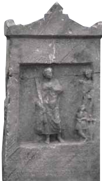
Hekataios'a ait mermer mezar taşı Yeldeğirmeni İstanbul Arkeoloji Müzeleri